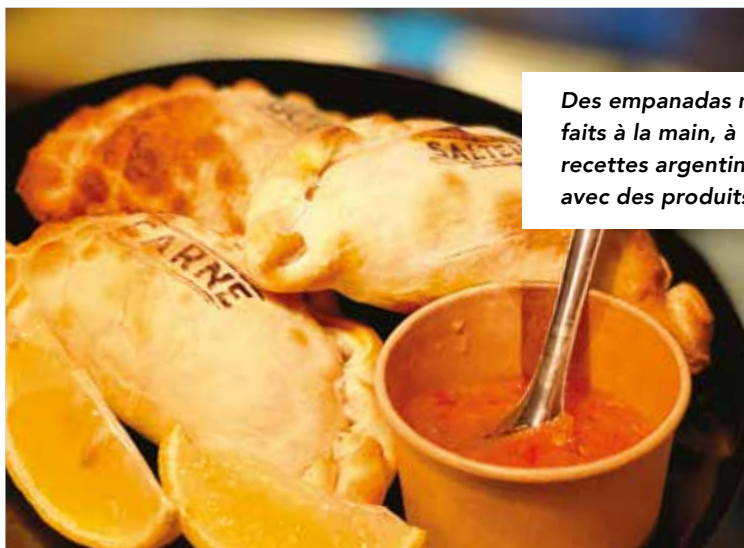
Des empanadas maison faits à la main, à base de recettes argentines revisitées avec des produits du terroir.